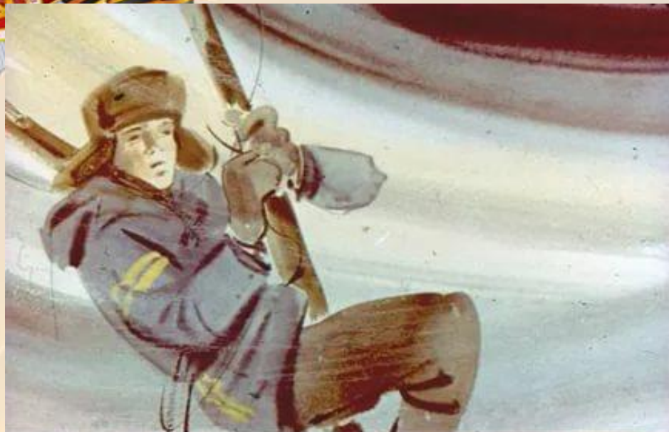
Я поймал обрывок провода, оставшийся от прежней антенны, и начал связывать его с концом, обмотанным вокруг талии. 26